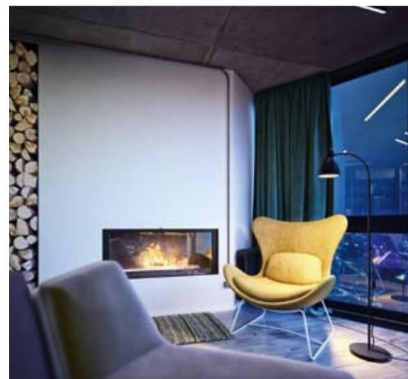
Четырехкомнатная квартира Общая площадь: 270 м 2